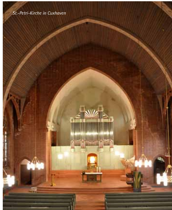
St.-Petri-Kirche in Cuxhaven

eigenen klanglichen Charme. Und sie alle sind eine Reise wert. Wenn Sie jetzt auf den Geschmack gekommen sind und selbst einmal „alle Register ziehen“ wollen, blättern Sie ruhig weiter: Bei den Partitoure 1, 2, 15 und 47 stehen Orgeln im musikalischen Mittelpunkt.